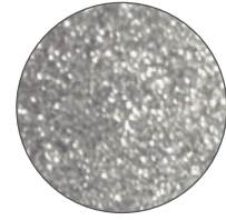
Acabado de diamantina